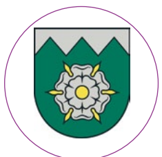
Gada pašvaldība TUKUMA NOVADA DOME