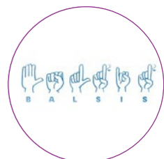
Gada inovācija kultūrā JAUNIEŠU KORA "BALSIŠS" ZIEMASSVĒTKU KONCERTI "KLUSA NAKTS"