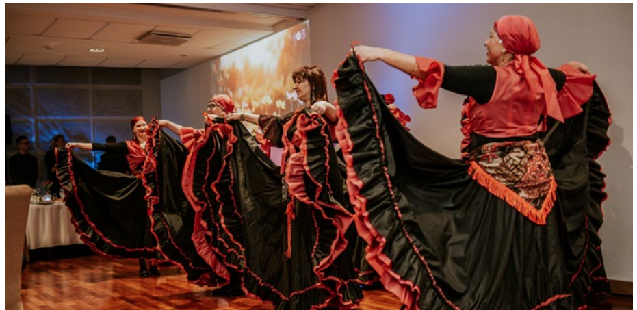
Ar priekšnesumu uzstājas LNS vidējās paaudzes deju kolektīvs “Rītausma”.