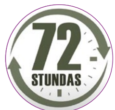
Gada pasākums VISAPTVEROŠA VALSTS AIZSARDZĪBA