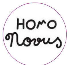
Gada notikums FESTIVĀLA "HOMO NOVUS" IZRĀDE ZĪMJU VALODĀ "ODA PRIEKAM"