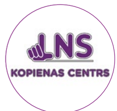
Gada struktūrvienība LNS KOPIENAS CENTRS