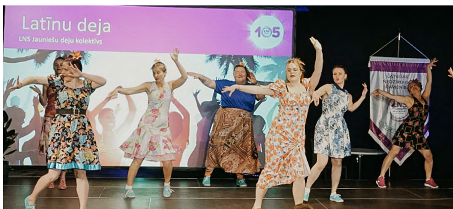
Jauniešu deju kolektīvs ienes pasākumā eksotiskas un vasariņas sajūtas.