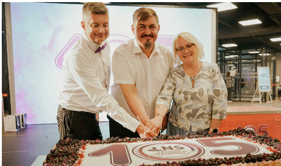
Jau tradicionāli LNS vadība kopīgi sagriež svētku torti.