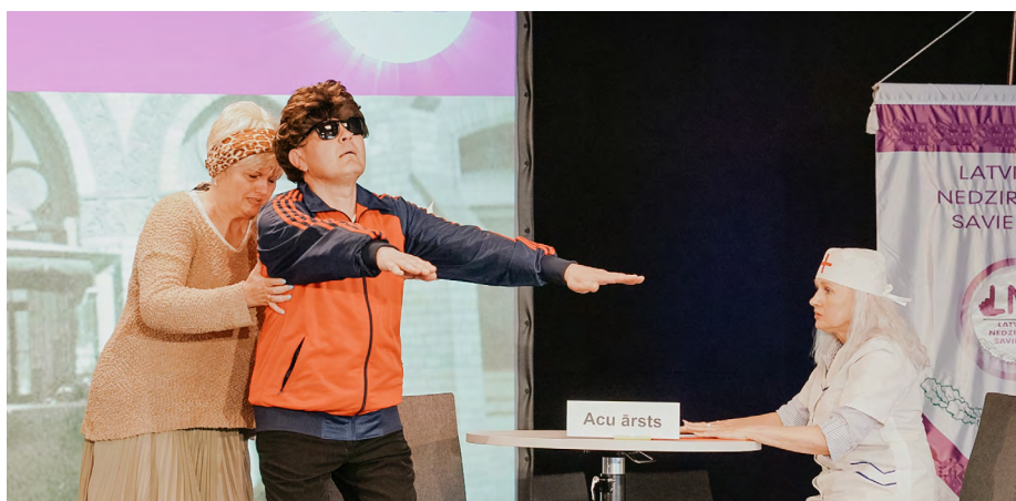
Daugavpīļieši ar humora uzvedumu uzjautrina sanākušos.