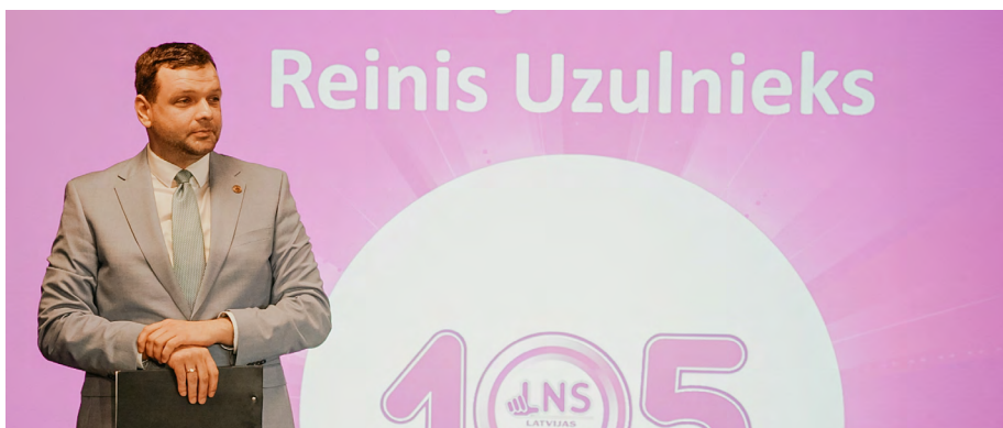
Labklājības ministrs Reinis Uzulnieks sveic LNS jubilejā.

Latvijas Nedzirdīgo savienības 105 gadu jubilejas pasākums pulcēja ļoti plašu apmeklētāju loku – koncertu vēroja vairāk nekā 300 skatītāju, savukārt vakara daļā piedalījās