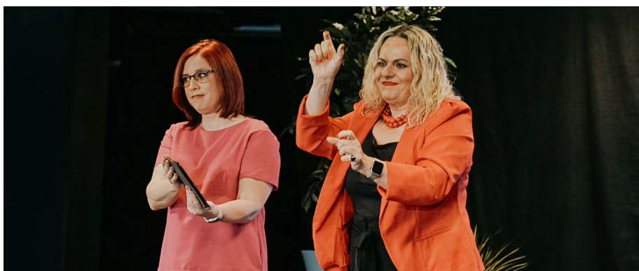
LNS jubilejā sveic EUD prezidente Sofija Isari no Grieķijas.