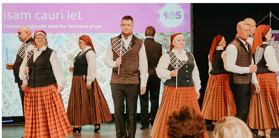
Ar tautisku priekšnesumu valmierieši piepilda jubilejas skatuvi.