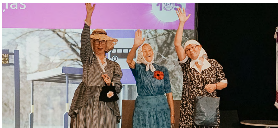
Kauņas dāmas iejūtas vecmāmiņu lomā un sasmidina publiku.