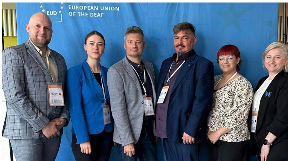
LNS vadība ar kolēģiem no Baltijas valstīm.

Nākamā EUD Ģenerālā asambleja notiks 2026. gada 16. maijā Kiprā. •