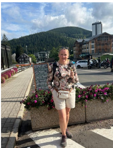
Čehija, 2024. gada augusts.

un man ir prieks, ka es varu palīdzēt sievietei dzemdību laikā justies droši. Otrs gandarījums ir kopienas centra darbs un cilvēki, kas nāk. Redzēt, kā kāds no viņiem arī izaug, pat ja viņš ir seniors. Kā mainās viņa domāšana, kā viņš iesaistās. Gadās, ka kāds iziet no depresijas – tas arī mums dod prieku. Piemēram, psihologs atsūta pie mums cilvēku ar depresiju, un te viņš beidzot smaida, ir priecīgs, piedalās pasākumos, nodarbībās un dažādās aktivitātēs. Manuprāt, tā ir lielākā dzīves alga – redzēt, ka cilvēks jūtas labi. Tāpēc jau mēs esam šeit, tāpēc jau šī ir Latvijas nedzirdīgo organizācija – mēs strādājam tieši viņiem.