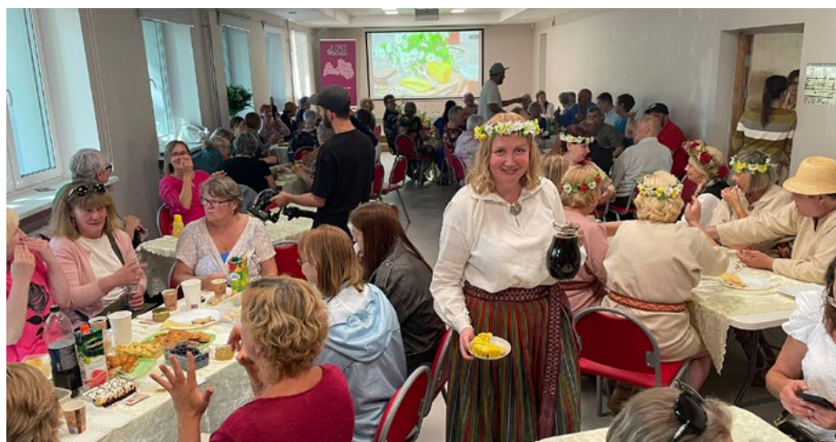
LNS Kopienas centra ielīgošanas pasākums, 2024. gads.

Lielākais gandarījums manā dzīvē noteikti ir būt klāt, kad pasaulē ienāk jauna dzīvība. To vārdiem nevaru aprakstīt, tas ir kaut kas unikāls – būt klāt tādā brīdī! Tas ir mans sirds darbs,