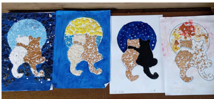
7. janvāris, LNS Kurzemes RB Ventspils grupa.