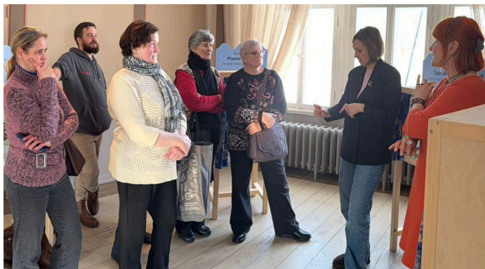
20. februāris, LNS Kurzemes RB Kuldīgas grupa.