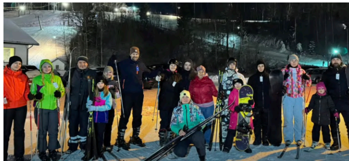
17. janvāris, LNS Rīgas RB Tukuma grupa.