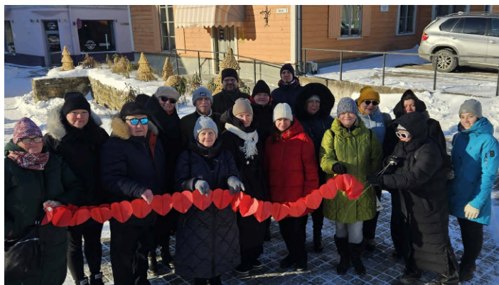
14. februāris, LNS Vidzemes RB Valmieras grupa.