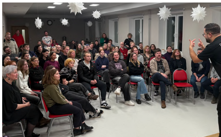
28. februāris, LNS Rīgas RB.