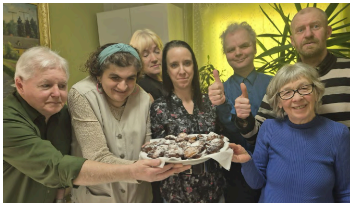
7. marts, LNS Vidzemes RB Smiltēnes grupa.