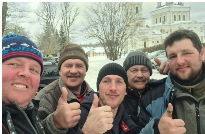
22. februāris, LNS Latgales RB Rēzeknes grupa.