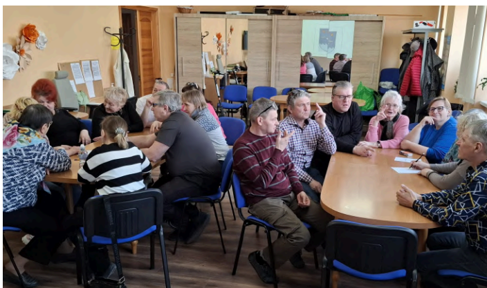
24. marts, LNS Latgales RB Daugavpils grupa.