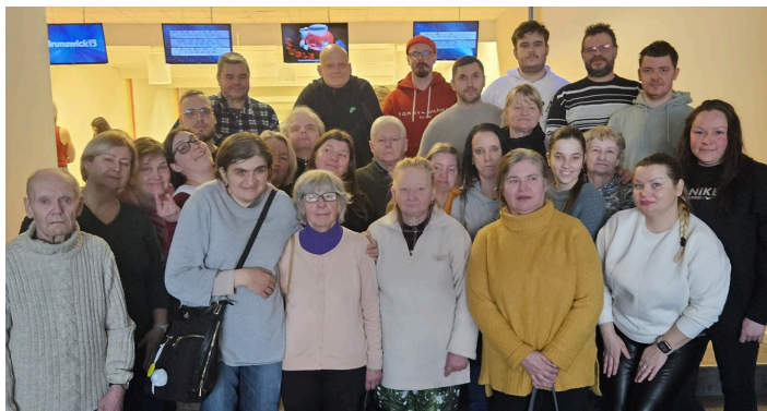
18. janvāris, LNS Vidzemes RB.