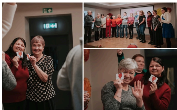
4. marts, LNS Rīgas RB.