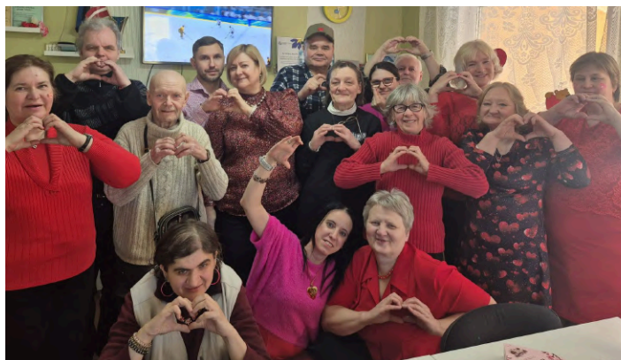
14. marts, LNS Vidzemes RB Smiltēnes grupa.