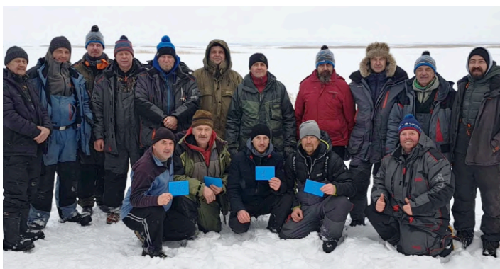
7.februāris, LNS Latgales RB Rēzeknes grupa.