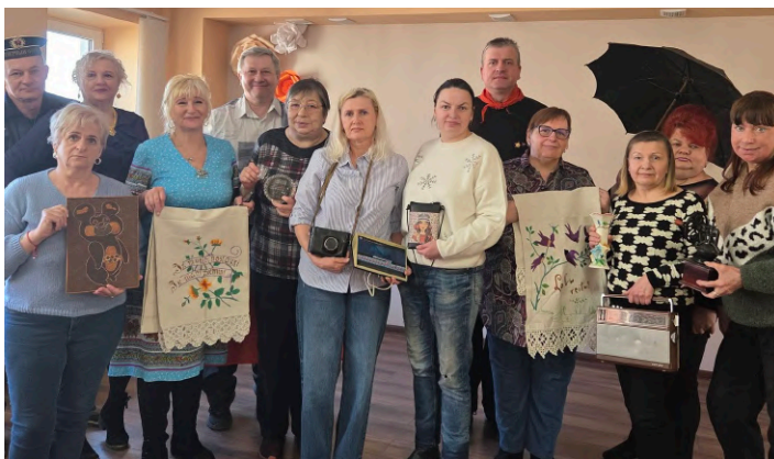
10. marts, LNS Latgales RB Daugavpils grupa.