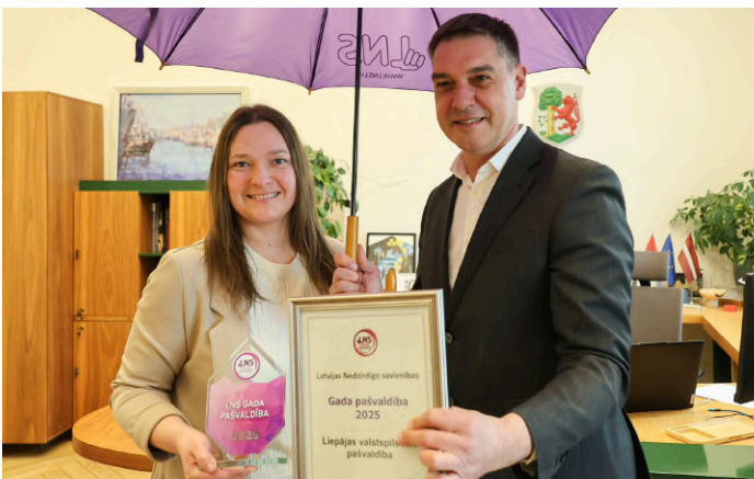
16. marts, LNS Kurzemes RB.