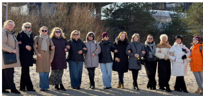
15. marts, LNS Rīgas RB Jelgavas grupa.