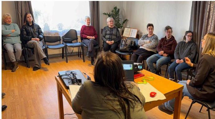
9. februāris, LNS Kurzemes RB Kuldīgas grupa.