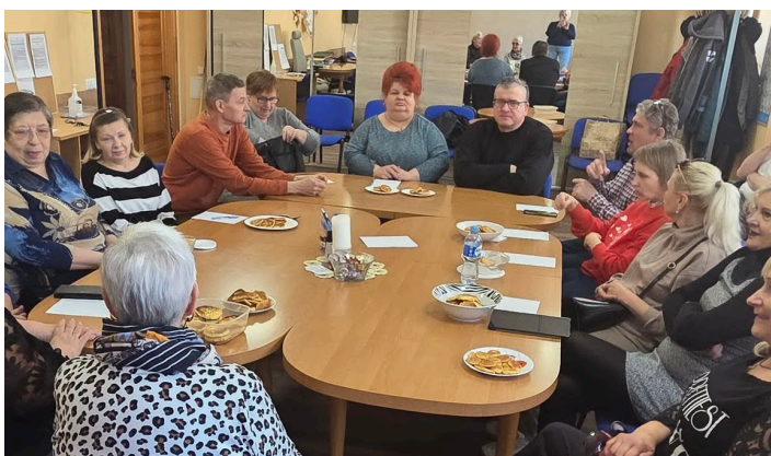
17. marts, LNS Latgales RB Daugavpils grupa.